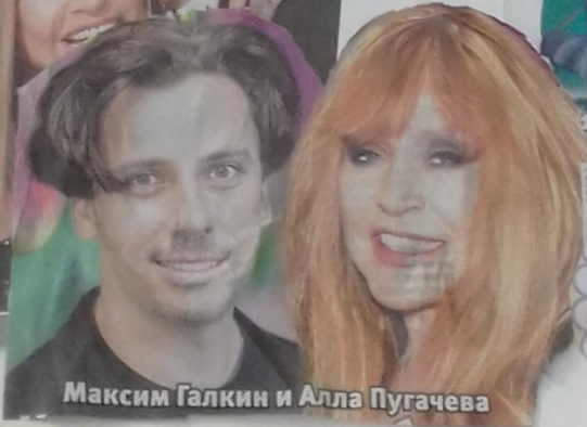
Максим Галкин и Алла Пугачева