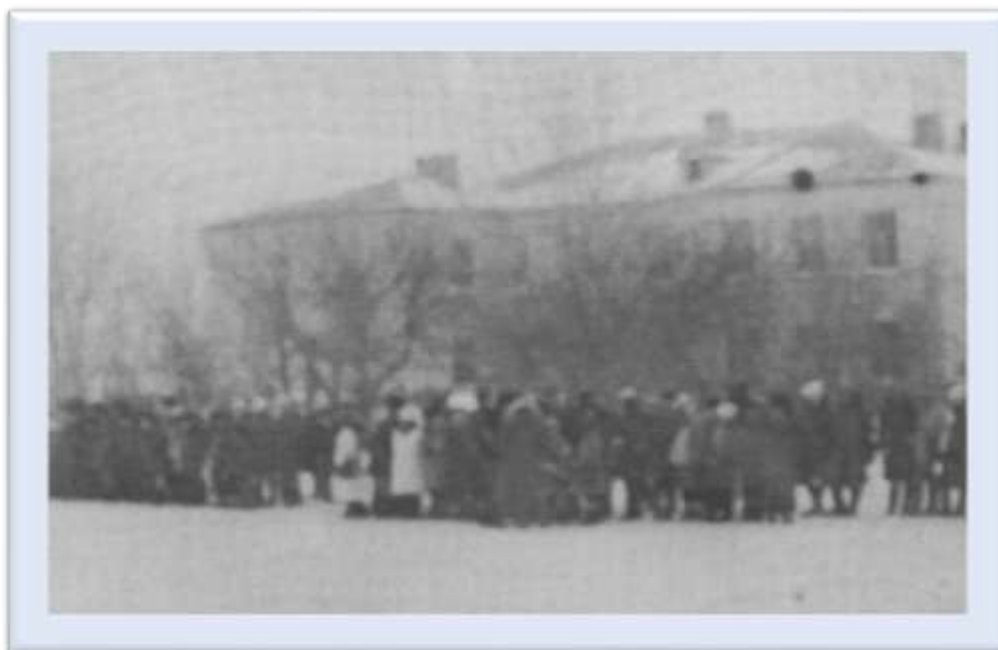
б) Жизнь устремленная вверх, и расписался на рейхстаге.