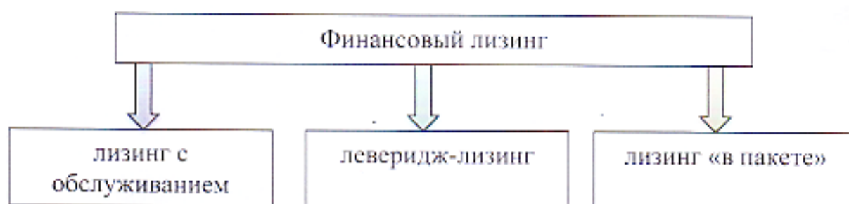
Рис.3. Основные виды финансового лизинга

Лизинг с обслуживанием представляет собой договор финансового лизинга, при котором возможно оказание целого ряда услуг, связанных с содержанием и обслуживанием оборудования.