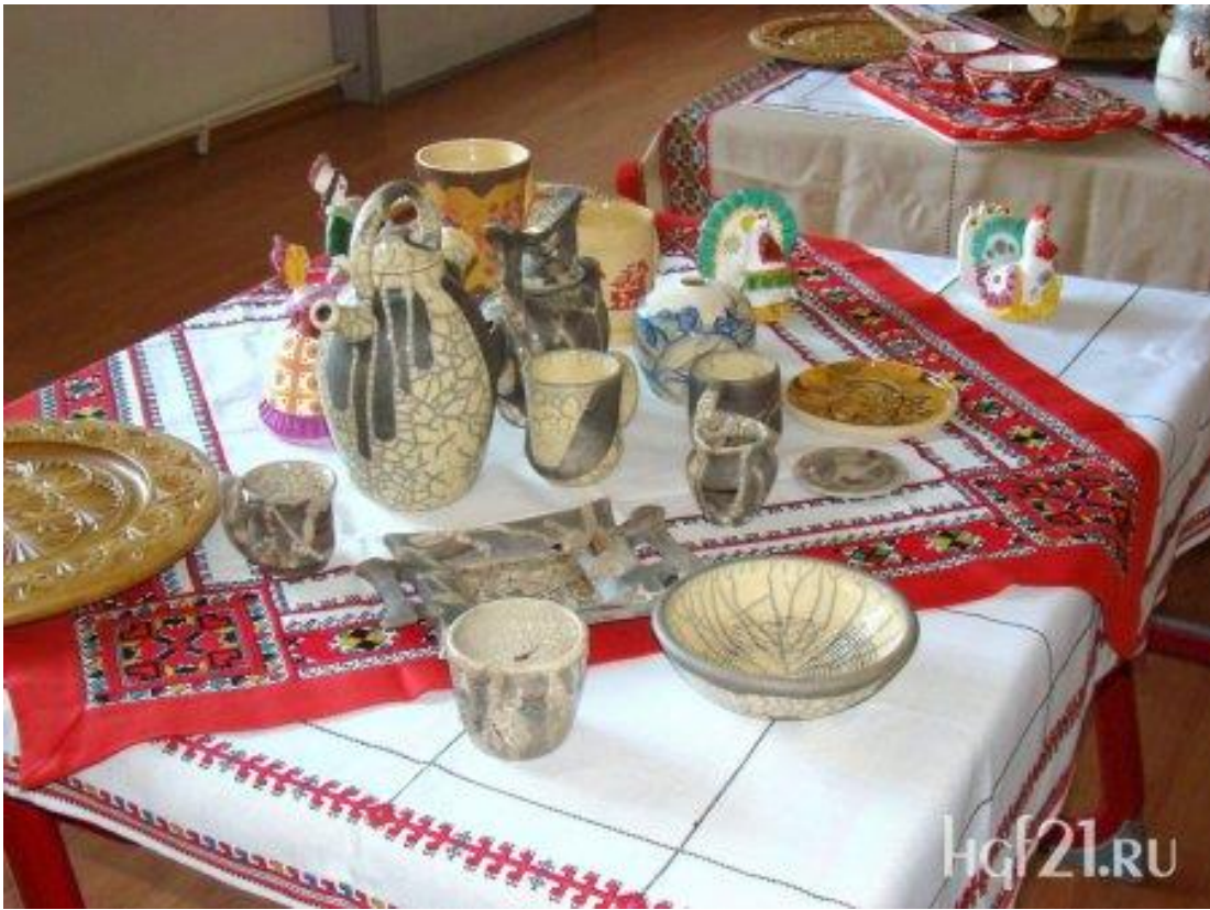
Декоративно – прикладное искусство