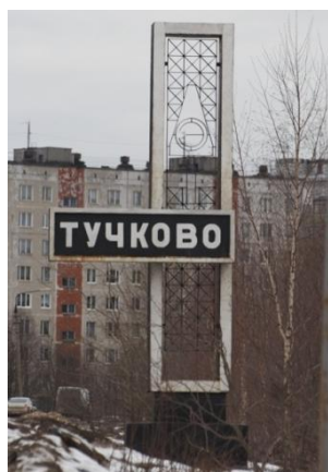
Знак на въезде в г.Тучково.