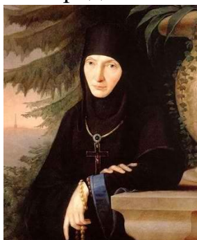
Игуменья Спасо-Бородинского монастыря Мария (Тучкова).