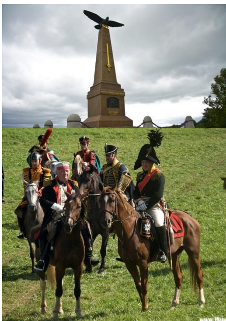
Памятник М.И.Кутузову. Архитектор П.Воронцов-Вельяминов. 1912г.