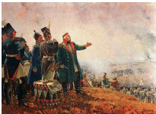
Кутузов на Бородинском поле. Художник С.В. Герасимов 1952 г.

Памятная медаль участника Бородинской битвы.