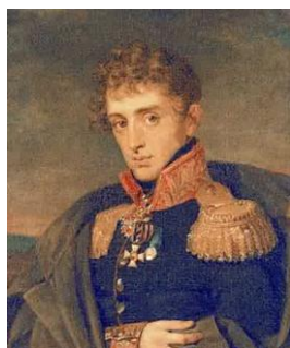
Портрет генерал-майора А.А. Тучкова. Художник Д. Доу