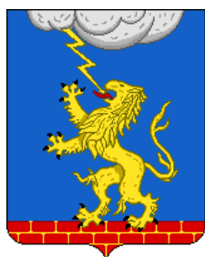
Герб г.Тучково Московской области.