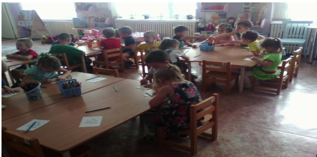
Фото -отчёт по акции.