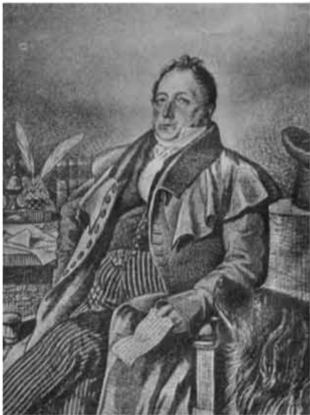
Отец А.С.Пушкина, Сергей Львович, 1770- 1838

Сергей Львович принадлежал к старинному дворянскому роду. Капитан лейб- гвардии Измайловского полка. Майор в отставке, статский советник. Был тесно связан с литературными кругами . Писал стихи и даже целые поэмы.