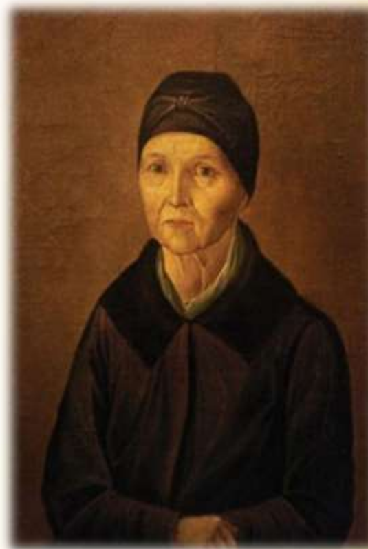
Няня Арина Родионовна