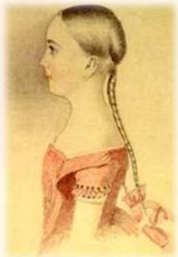
Мария Александровна Пушкина (1832-1919г.)

У Александра Сергеевича и Натальи Николаевны было четверо детей.