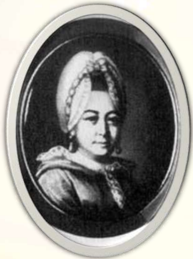
Мария Алексеевна, бабушка Александра Сергеевича

Любовь к родному языку Пушкину привили бабушка Мария Алексеевна Ганнибал, превосходно писавшая и говорившая по-русски, и няня Арина Родионовна.