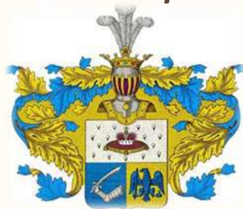
Герб семьи Пушкиных

Предки Александра Сергеевича были дворянами еще при царе Иване Грозном.