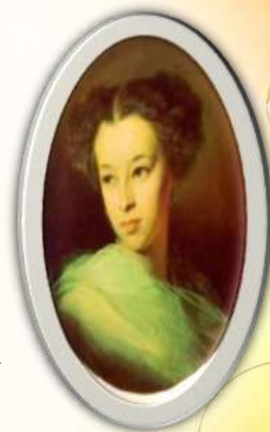
Наталья Александровна Пушкина (1836-1913г.)