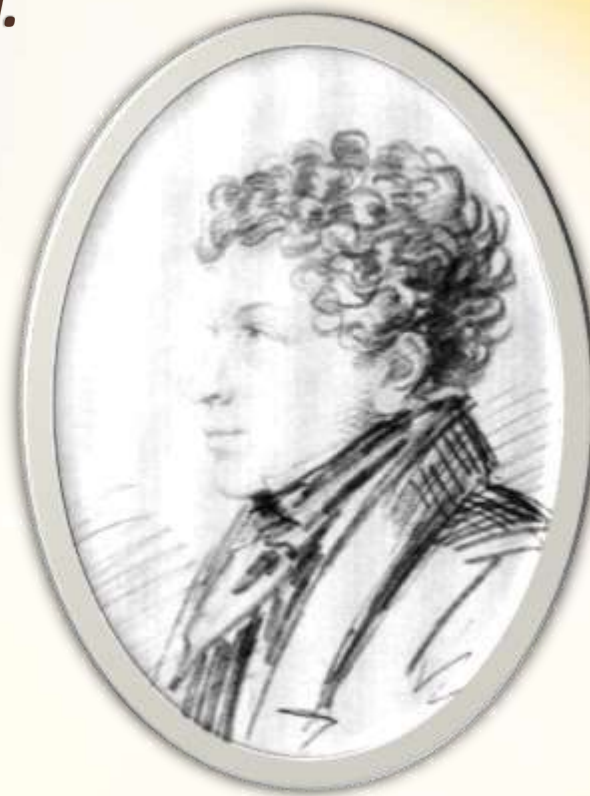
Брат, Лев Сергеевич Пушкин, 1805-1852