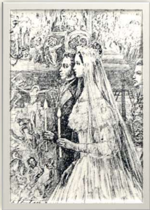
Венчание Пушкина, 1831 год

18 апреля 1831 года в Москве Пушкин обвенчался с Натальей Гончаровой.