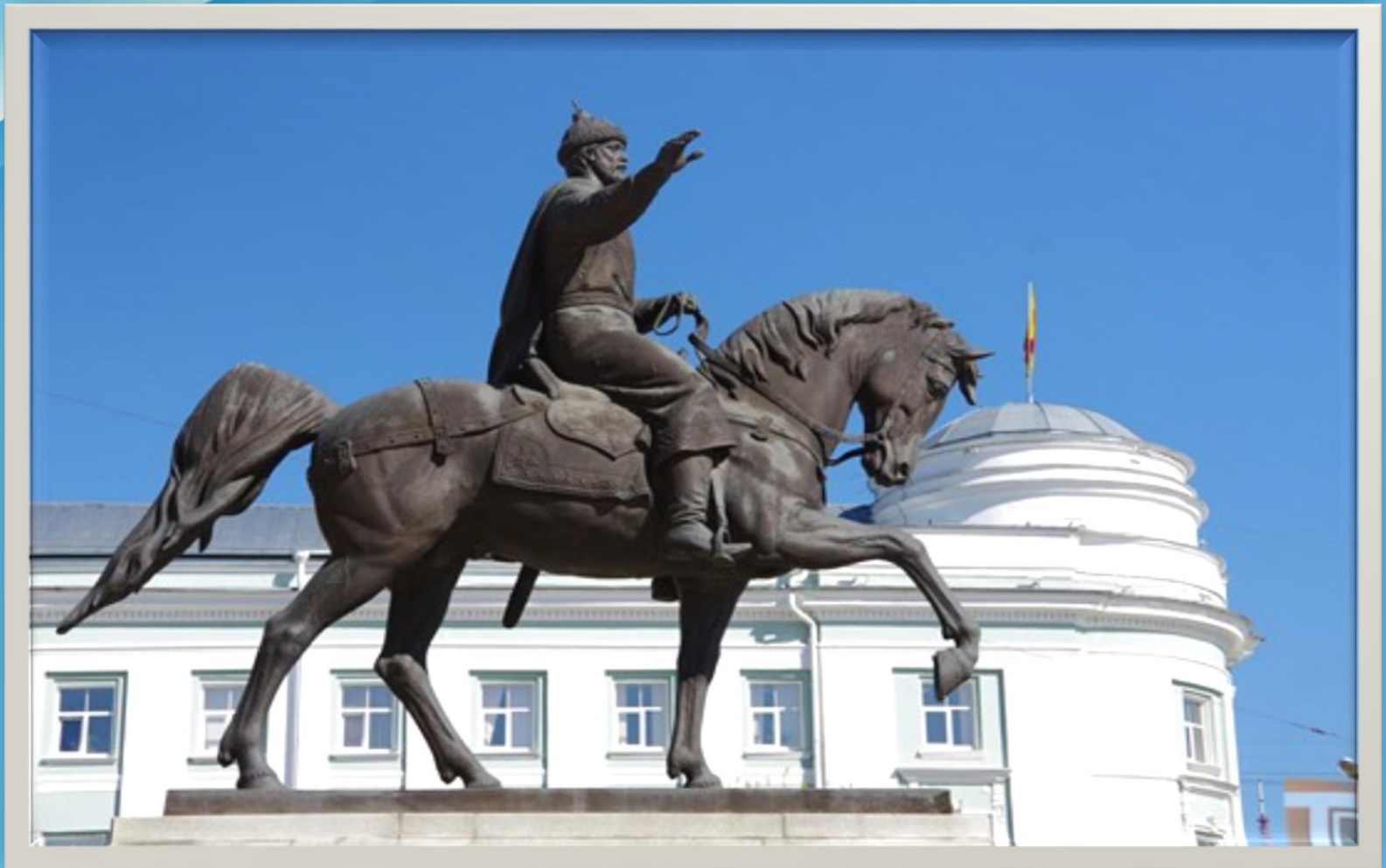
Памятник князю Михаилу Тверскому