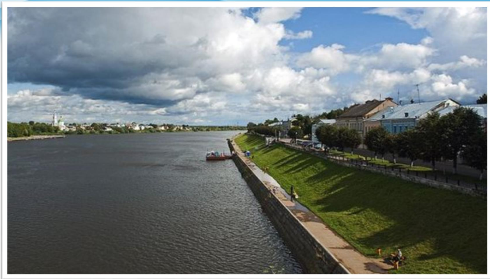
Набережная Михаила Ярославича