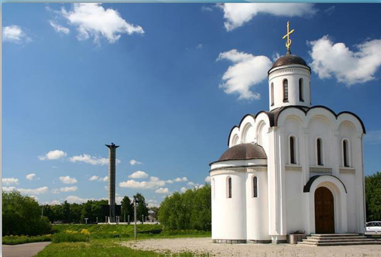
Храм святого Михаила Тверского на острове Памяти. Г. Тверь