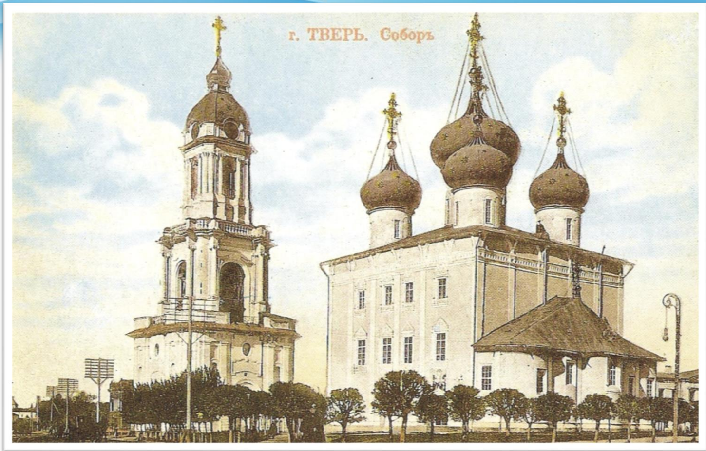
Тверской Спасо-Преображенский собор 1285 год.