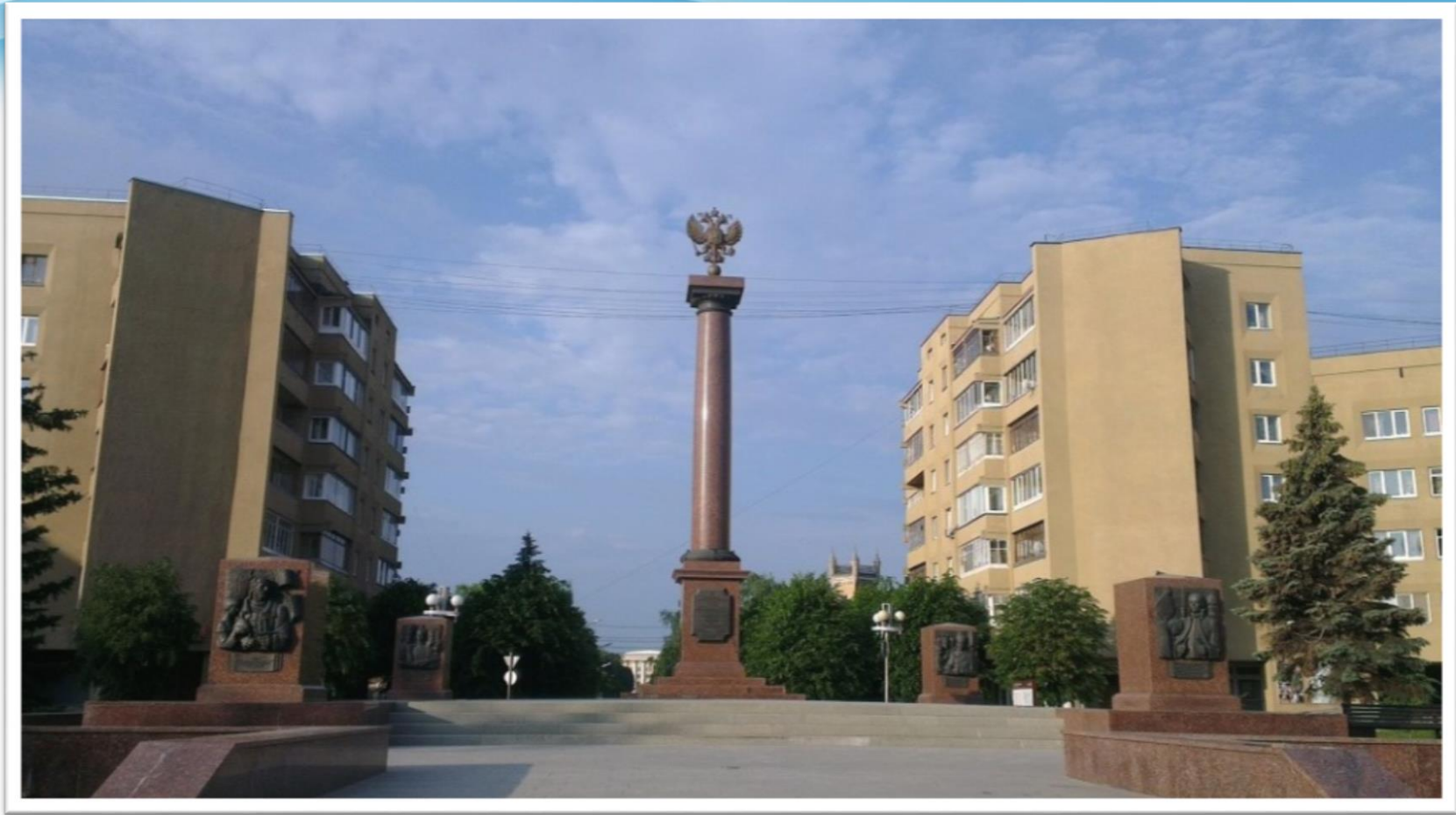
Памятник – стела «Город воинской славы» г. Тверь