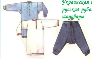
Украинская и русская рубахи и шаровары