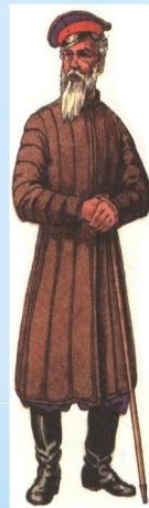
Старик в архалуке