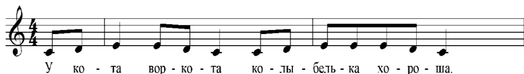
Рисунок №3 попевка «У кота»

«Тик-так»- интонирование устойчивых ступеней (III-I.) Первоначальный навык исполнения staccato.