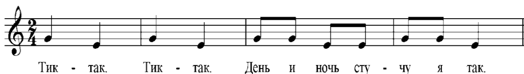
Рисунок №4 попевка «Тик-так»

«Дождик»- исполнение мелодии с поступенным и скачкообразным движением в пределах I-III ступеней. Продолжение работы над вокальным дыханием.