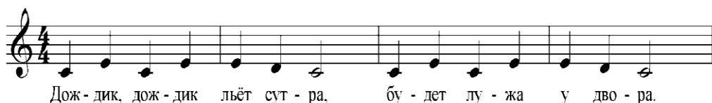
Рисунок №5 попевка «Дождик»

«Зайка» - интонирование нисходящего поступенного движения в пределах кварты.