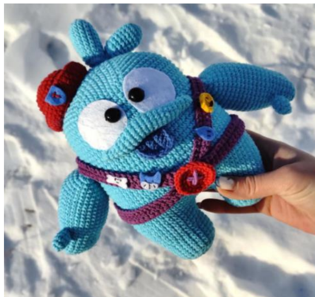
Рис.3 Персонаж игры Скуик

Идея 2. Можно связать игрушку традиционной формы – это зайчики, кошечки, собачки, медвежата. Такие игрушки прививают любовь к природе