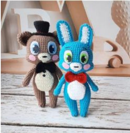
Рис.1 Бонни И Мишка Фредди