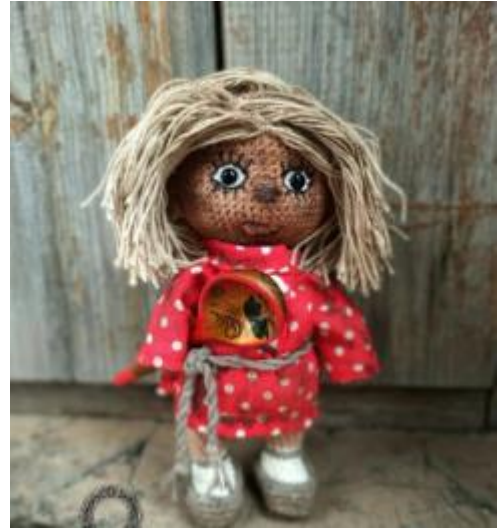
Рис.2 Домовенок Кузя