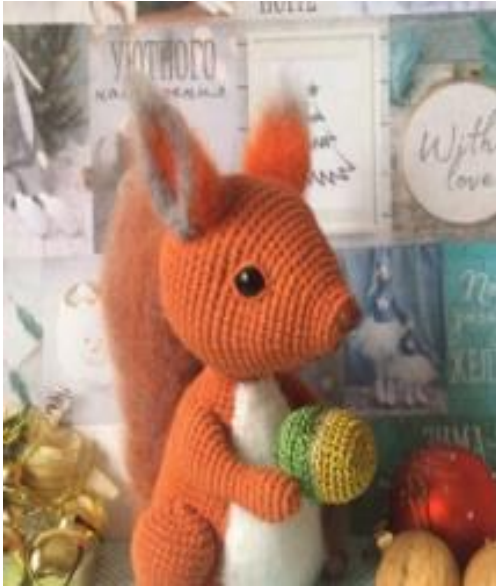
Рис.4 Игрушка Белка