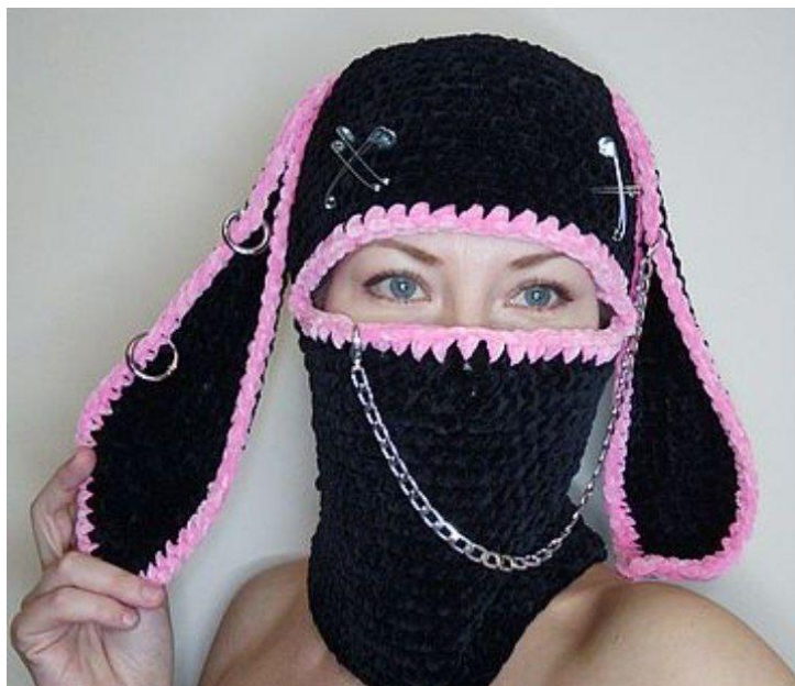
Идея 2. Балаклава с дополнительными украшениями