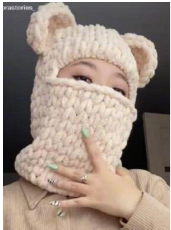
Идея 3. Балаклава с ушами мышки . Балаклава с ушами медведя