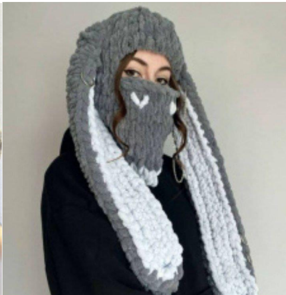
Балаклава с ушами зайца (длинные, короткие)