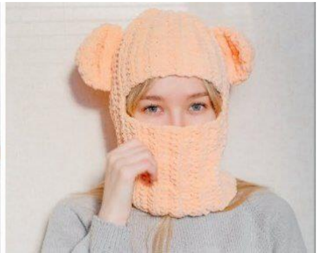
Идея 1. Балаклава подвёрнутая в шапку и в обычном состоянии