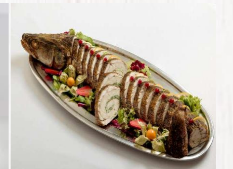
Разделка рыбы для фарширования