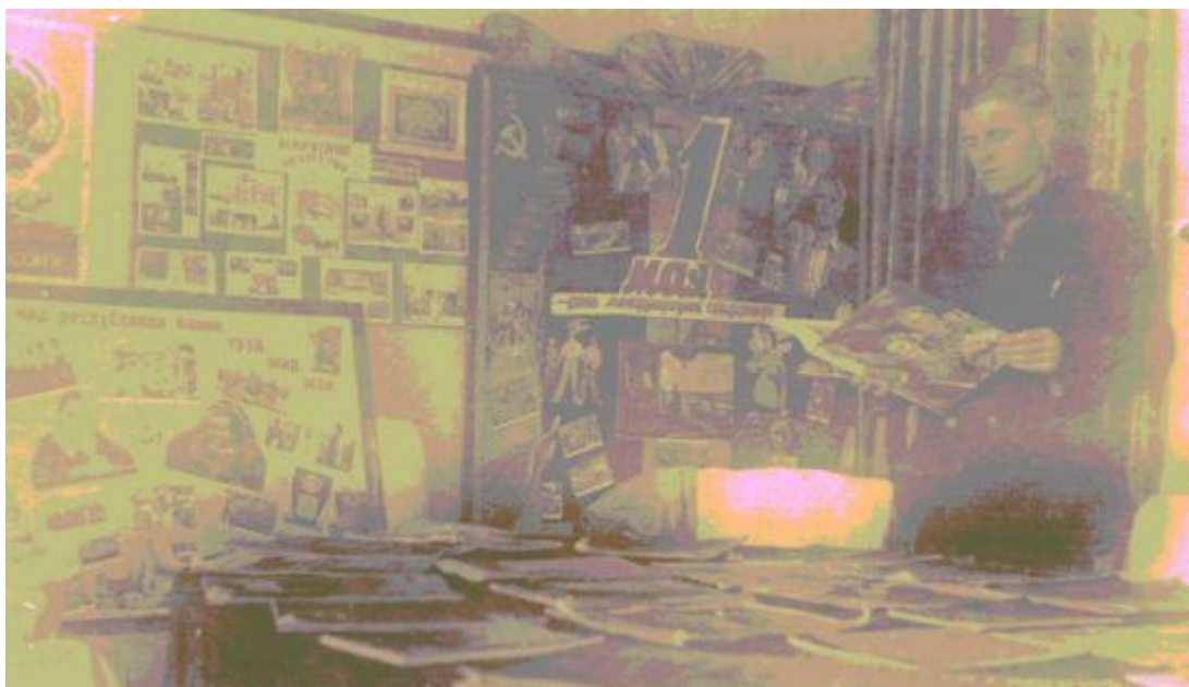
Библиотека в санатории имени XVIII съезда ВКП(б) 1954 г

В последние годы прадедушка жил и работал в городе-курорте Сухуми в обществе слепых. Он читал лекции, проводил политлинейки, вел активную общественную деятельность. По рассказам моей мамы дедушка на протяжении всей своей жизни занимался самообразованием, много читал, у него была собрана огромная библиотека книг. Прадед был человеком широкой души, любил детей, всегда старался помочь чем мог, делом или советом. Любимой его песней была: «Имел бы я золотые горы». Эта песня олицетворяет ширину его души, нежности, внимания и заботы к детям. Прадед прожил всего 64 года, ранения, полученные на войне, дали о себе знать, в 1992 году в г. Сухуми он умер.