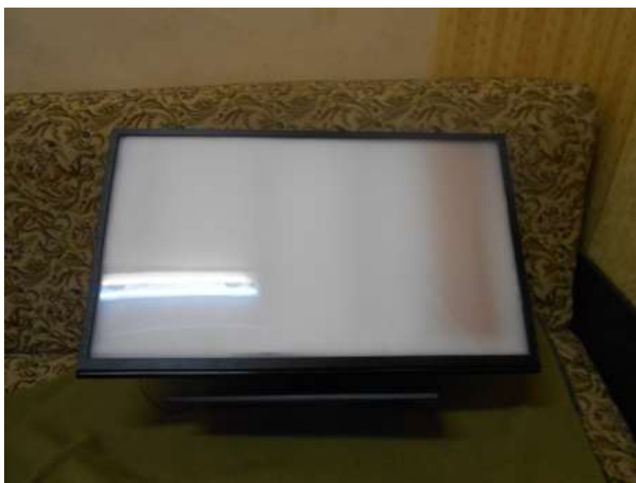
Собранный экран (вид спереди)