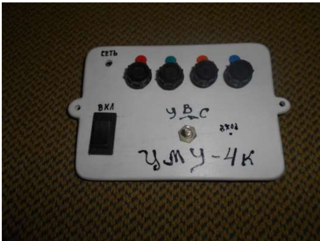
Передняя панель в сборе