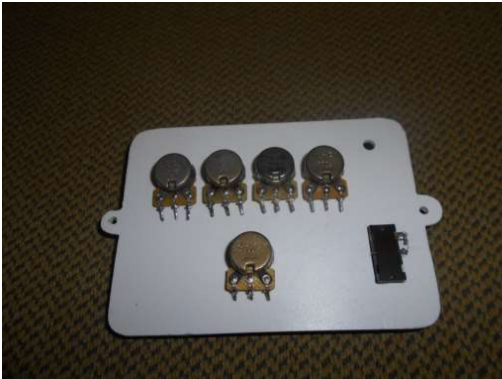
Монтаж элементов на передней панели