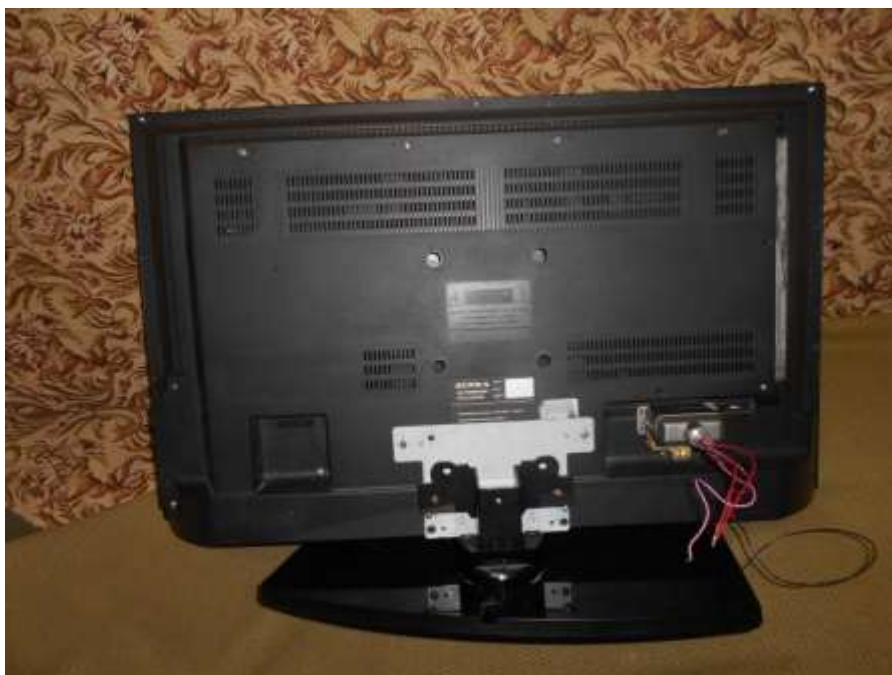
Собранный экран (вид сзади)