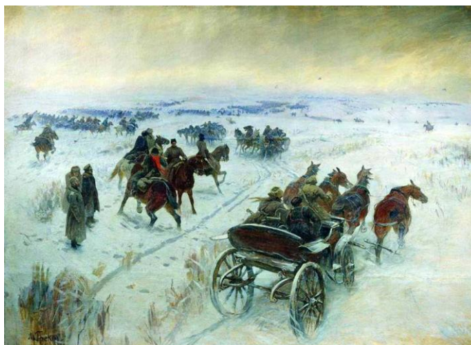
М.Греков. «Бой под Егорлыцкой»