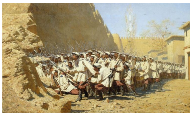
В.Верещагин. «У крепостной стены. Пусть войдут...»