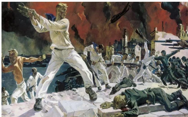
А.Дейнека. «Оборона Севастополя»