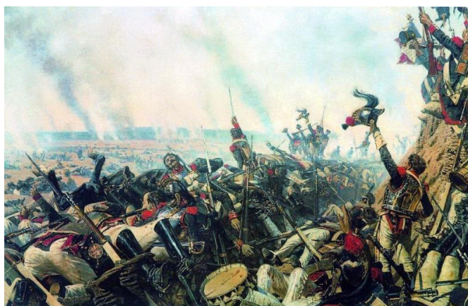
В.Верещагин. «Конец Бородинской битвы»