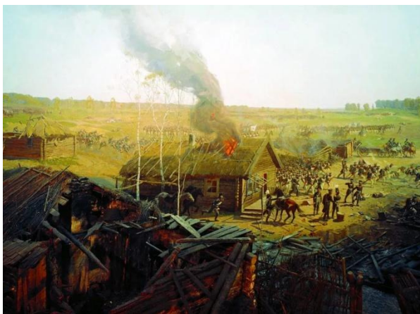
Ф.Рубо. Панорама «Бородинская битва» (фрагмент)

К столетию Отечественной войны 1812 года по заказу императора Николая II Ф.Рубо написал панораму «Бородинская битва», изображающую Бородинское сражение. Первоначально панорама была открыта в 1912 году в специально построенном павильоне на Чистых прудах в Москве. В 1918 году панорама была демонтирована и, после длительной реставрации, вновь открыта к 150-летию битвы в 1962 году в здании музея-панорамы на Кутузовском проспекте.