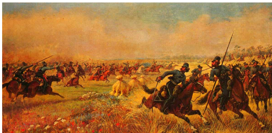
В.Мазуровский. «Дело казаков Платова под Миром 9 июля 1812г.»

армии (1895—1904). Во время русско-японской войны Мазуровский был на фронте, создал цикл работ «С японской войны» (1905). После возвращения продолжил рисовать батальные сцены (1906—1914). С началом первой мировой войны также был на фронте, где рисовал цикл картин посвященных мировой войне (1914—1917).