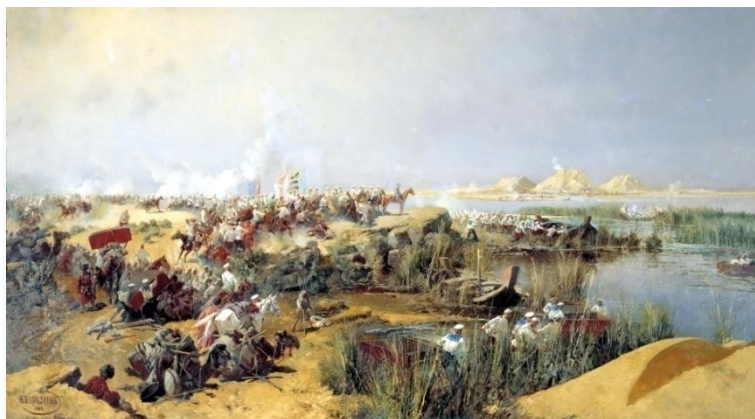
Н. Каразин. «Переправа Туркестанского отряда у Шейх-арыка»