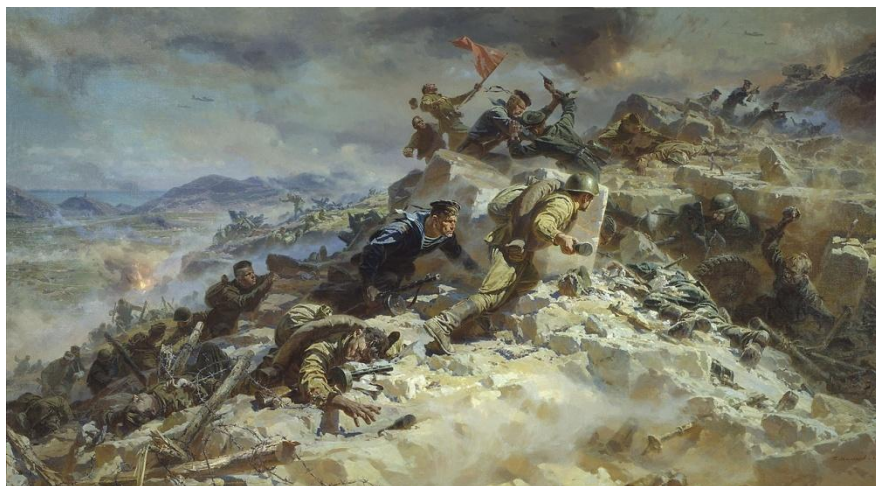
П.Мальцев. «Штурм Сапун горы»