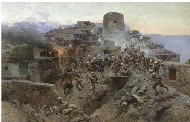
Ф.Рубо. «Штурм аула Гимры»

Во время обучения в академии молодой художник часто приезжал в Россию и писал огромное количество этюдов с натуры, жанровых композиций и батальных сцен. В эти годы были написаны картины «Атака запорожцев в степи», «Кавказец-кавалерист» и ещё целая галерея работ, которые показали, что в России появился талантливый художник-баталист.