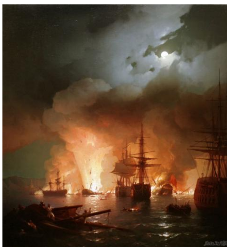
И.Айвазовский «Чесменский бой»

Живописец Главного Морского штаба, академик и почетный член Императорской Академии художеств в Амстердаме, Риме, Париже, Флоренции и Штутгарте. Окончил императорскую Академию художеств в Санкт - Петербурге. Айвазовский знаменит своими морскими пейзажами и сражениями. Художник никогда в жизни не был вольным творцом. Занимая должность художника в Главном морском штабе, он постоянно направлялся в места сражений для оперативного изображения боевых действий, так как запечатлеть их в те времена могли только живописцы. Множество картин были написаны из рассказов очевидцев. Многочисленными батальными полотнами И.К.Айвазовский прославил героев-моряков, отважно защищавших свое Отечество. Его творчество помогает хранить память о славных боевых традициях военно-морского флота.