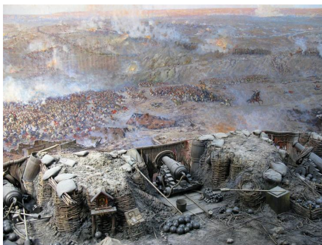
Ф.Рубо. Панорама «Оборона Севастополя» (фрагмент)