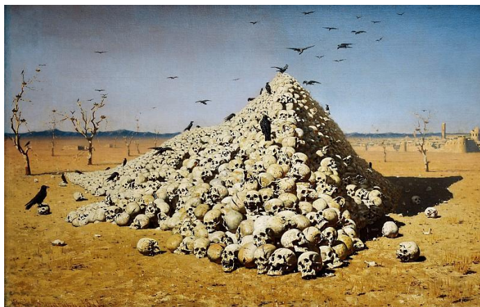
В.Верещагин. «Апофеоз войны»